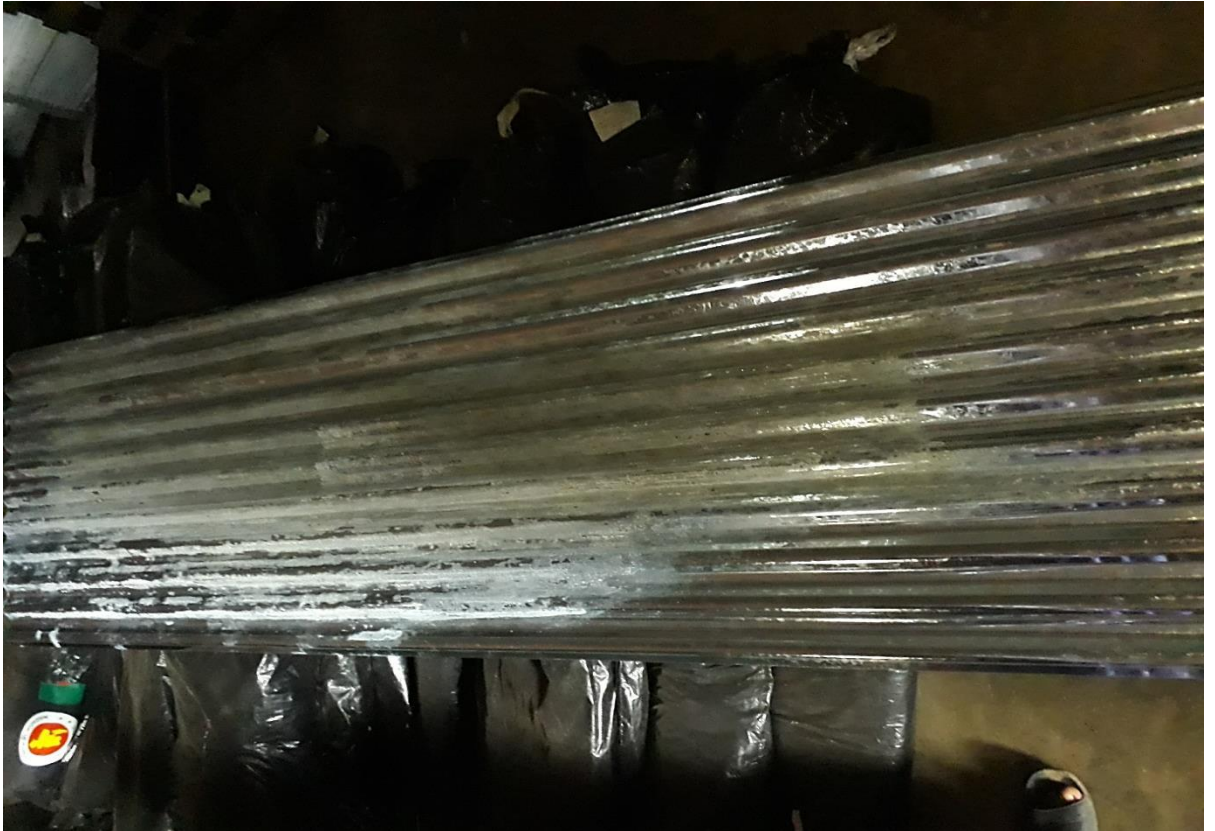
চট্টগ্রাম District Relief and Rehabilitation Office (DRRO) অফিস এর ত্রান গুদাম ২০১৮-২০১৯ অর্থ বছরে গ্রহণকৃত ডেউটিন সরেজমিনে যাচাইয়।